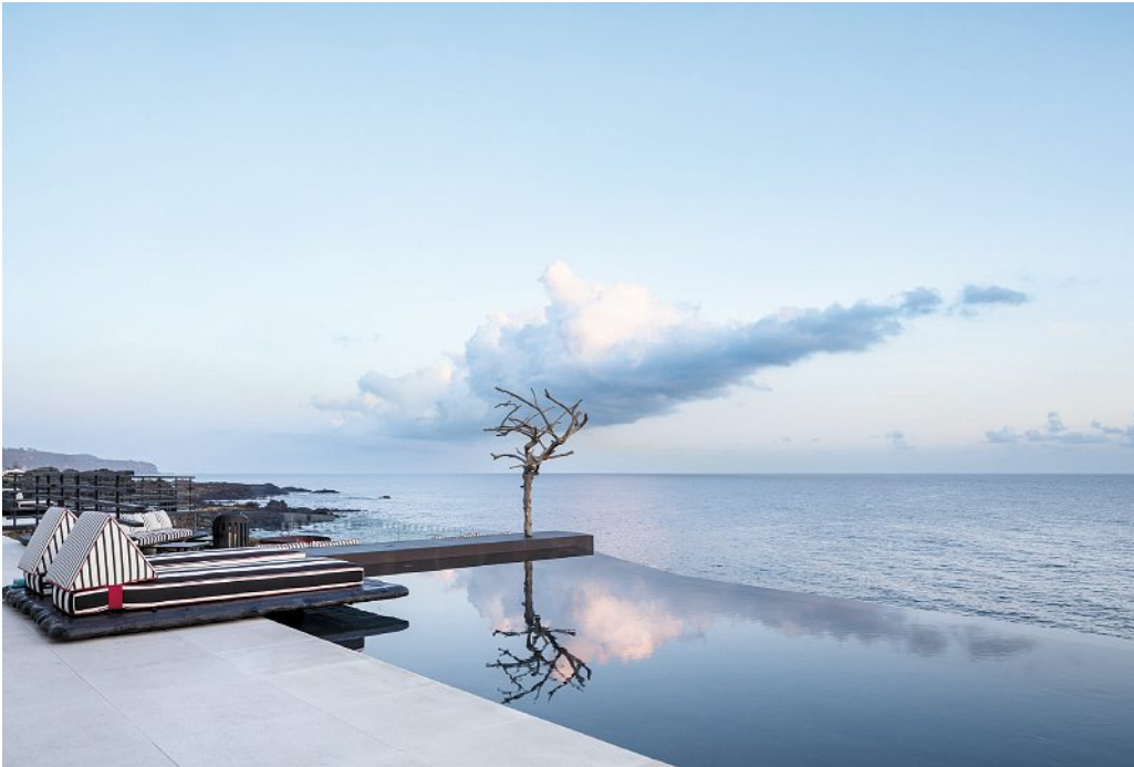
Entre paysages volcaniques et immensité atlantique, le White invite au ressourcement.

ARCHIPEL DES AÇORES Sur l'île de São Miguel, le White rend hommage au terroir volcanique de l'archipel, avec l'Atlantique pour seul vis-à-vis.